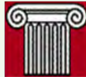
Akademisches Gymnasium Spittelwiese