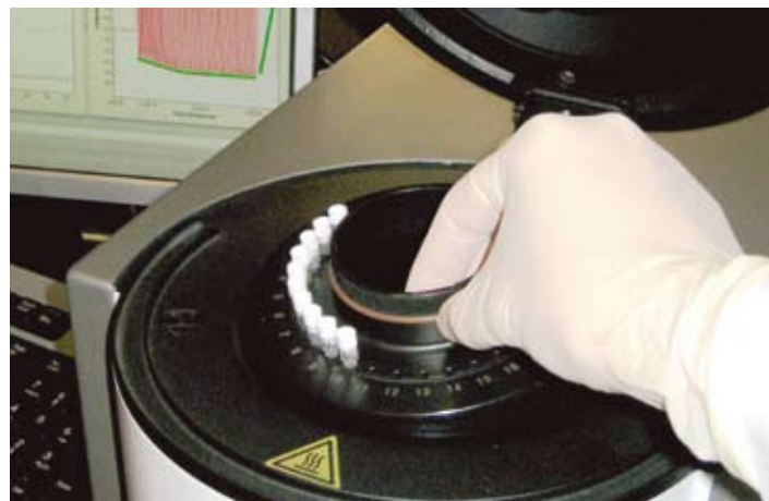
Molekularno biološko u/s/tvrđjivanje uzročnika/izazivača

Prema dosadašnjim spoznajama od životinja ne proizlazi nikakva opasnost zaraze za čovjeka.