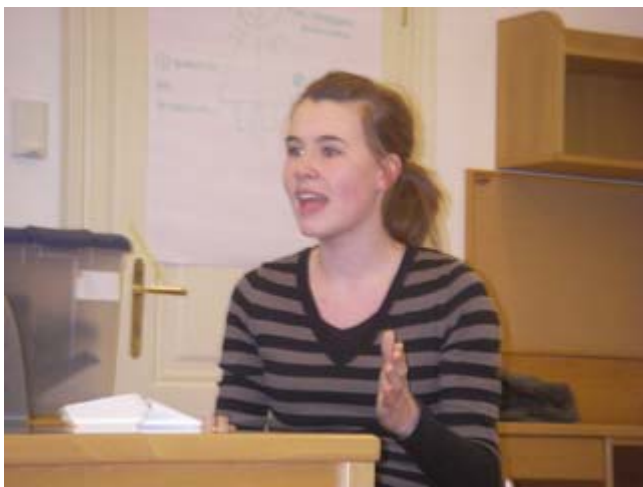
Überzeugend wie unsere Politiker