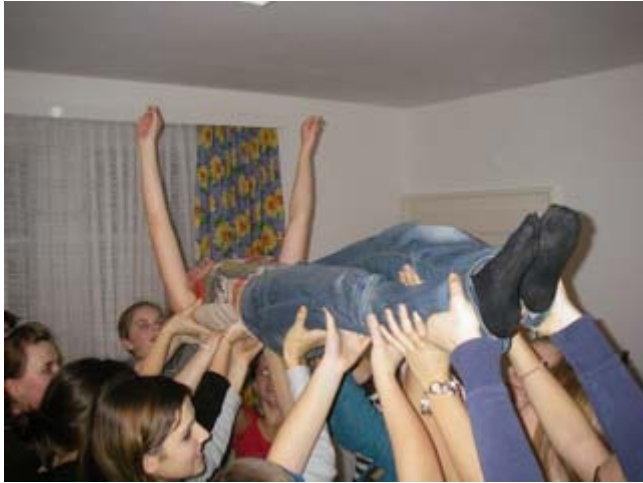
ein erhebendes Gefühl