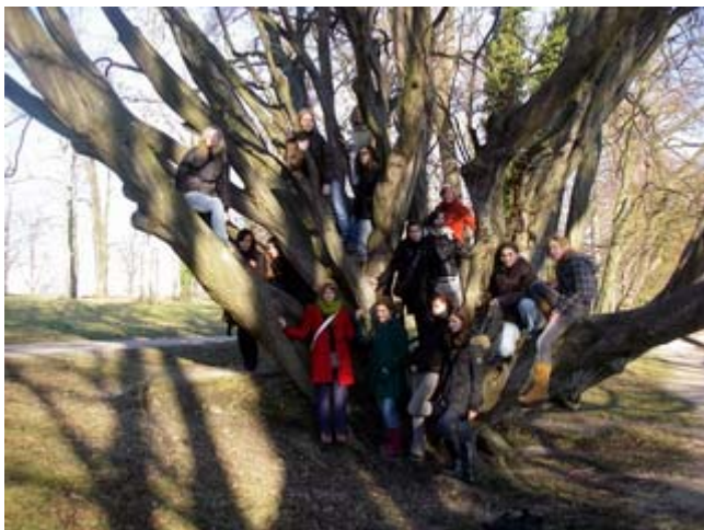
In Verbindung stehen