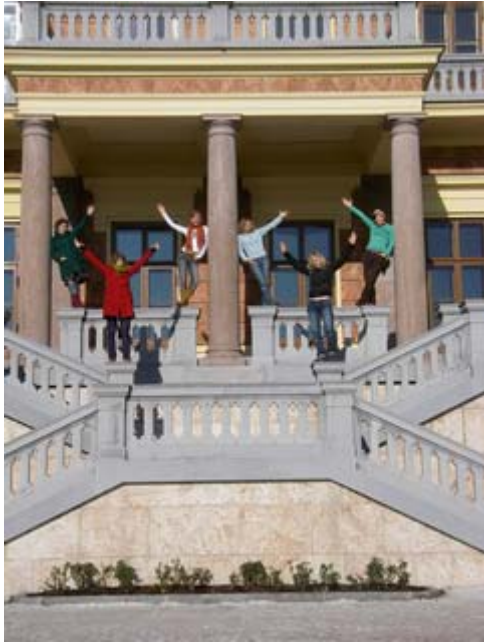
Die schönste Kulisse ....