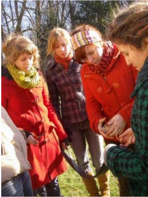
Gemeinsam Lösungen finden