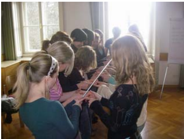
Gemeinsam zum Ziel kommen